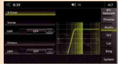
Hoch- und Tiefpassfilter sind vorhanden

gespielt werden kann. Selbstverständlich können Smartphones auch drahtlos per Bluetooth gekoppelt werden. Komfortables Telefonieren ist dann ebenso möglich wie kabelloses Audiostreaming. Kompatible Smartphones lassen sich zudem per HDMI koppeln.